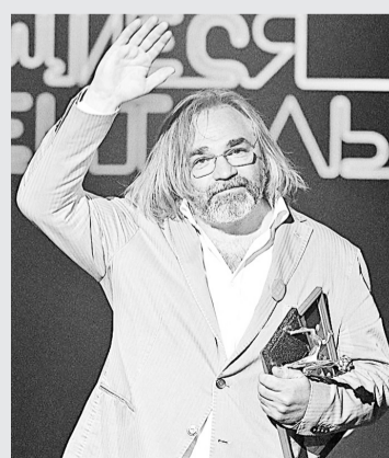
2021 г. Один из ведущих документалистов мира