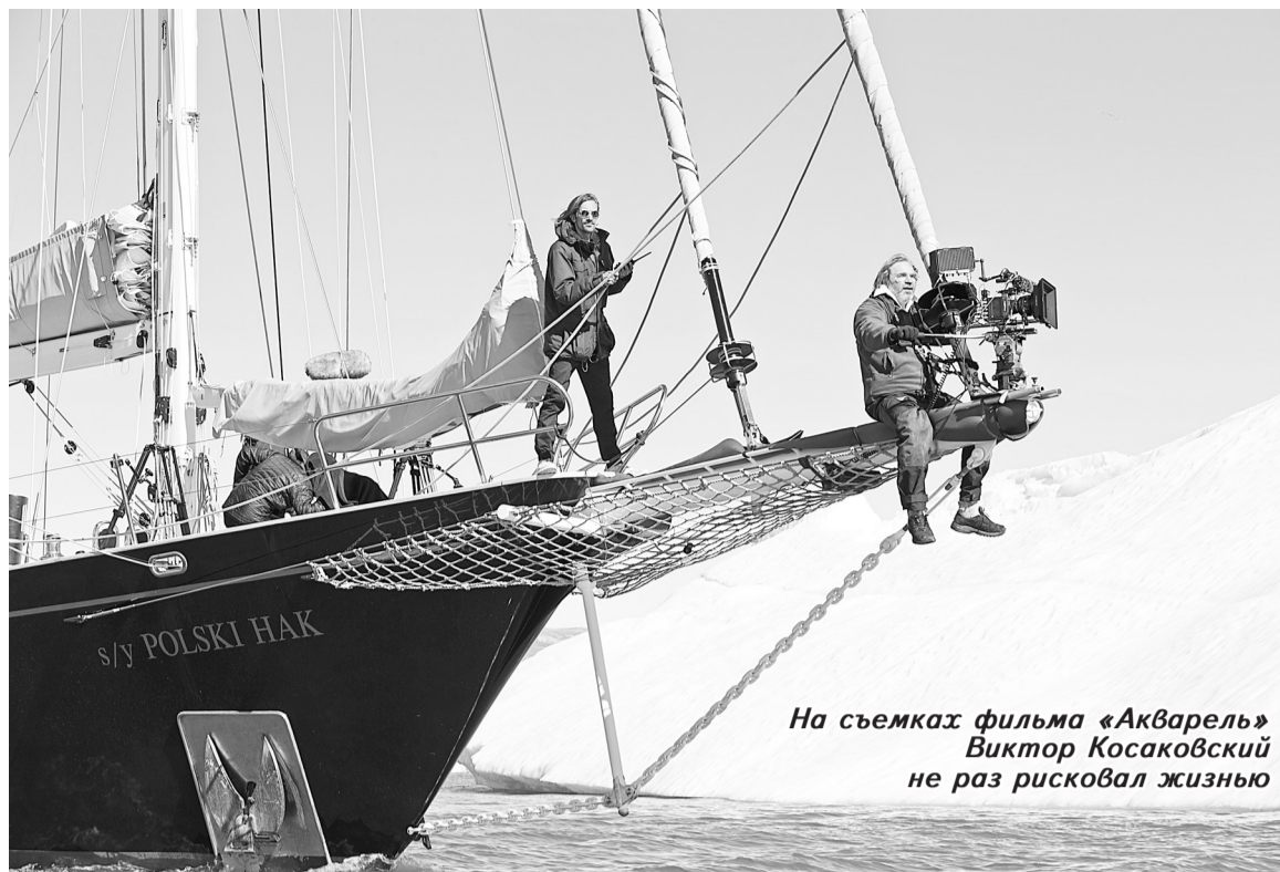
На съемках фильма «Акварель» Виктор Косаковский не раз рисковал жизнью