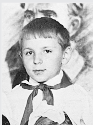
1970 г. Третьеклассник школы № 11 г. Боровичи

— В России фильм тоже покажут, но не во всех кинотеатрах — скорее всего, только в городах-миллионниках, до Боровичей точно не дойдёт. Но через год-два я постараюсь приехать и показать боровичанам все мои фильмы. До встречи!