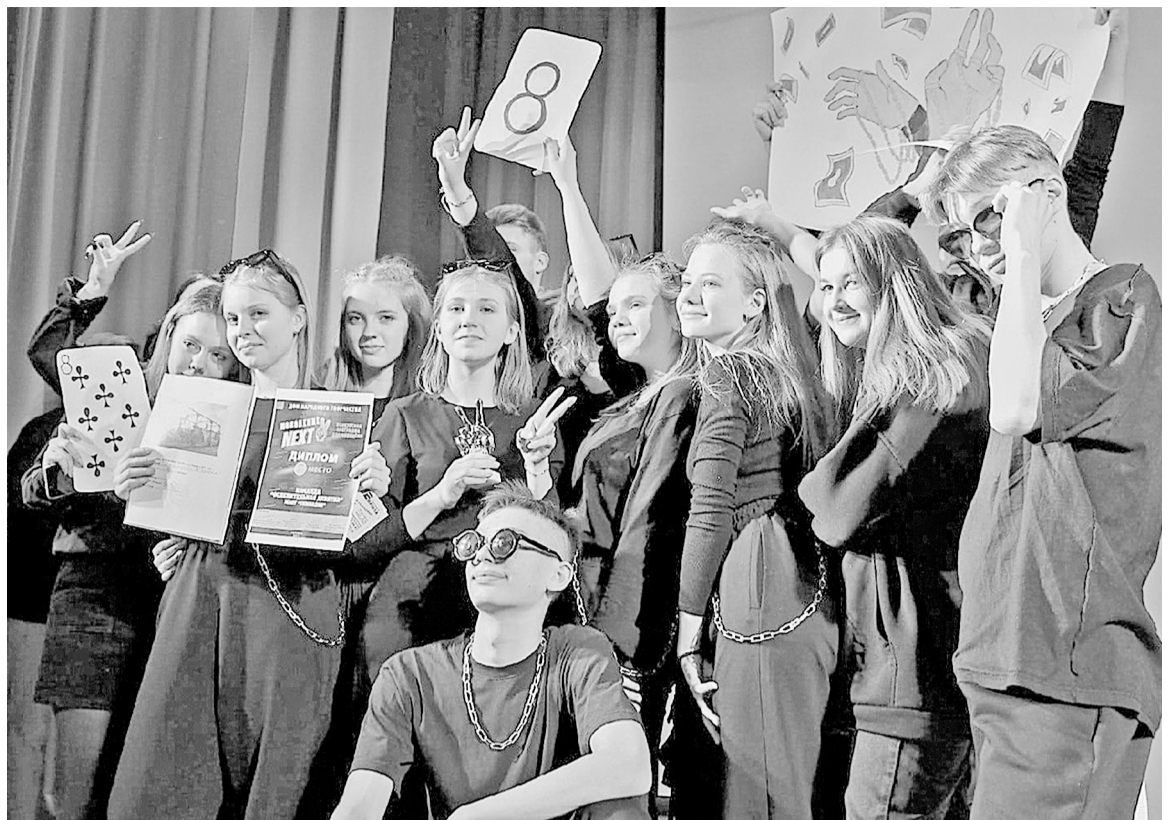
Команда победителей из гимназии

...Была объявлена минута молчания. Михаил ВАСИЛЬЕВ.